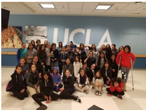
Our 7 th Grade girls at UCLA STEM Day!