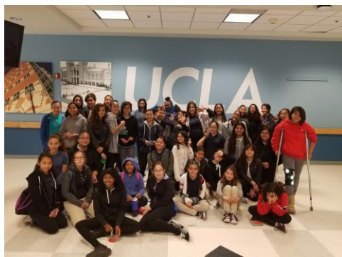
Nuestras niñas del 7º Grado en su paso de UCLA Día de STEM!